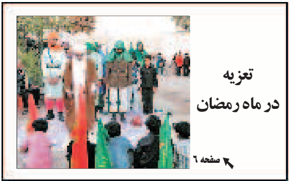
تعزیه در ماه رمضان