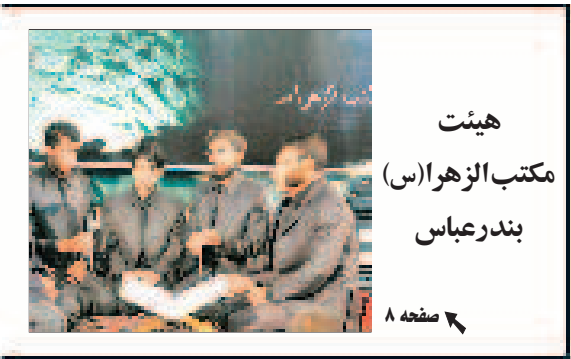
هیئت مکتب الزهرا(س) بندرعباس