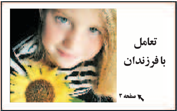
تعامل با فرزندان